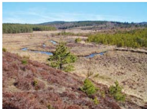
Fond de vallon humide et cours d'eau

En période de sécheresse, ces zones constituent une bonne réserve fourragère .