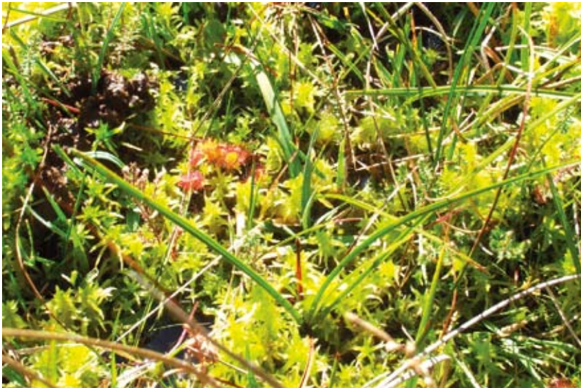
Végétation caractéristique des tourbières : sphaignes et droséras