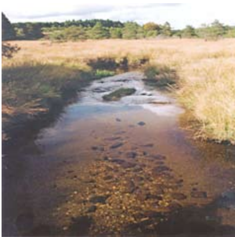
Cours d'eau en zone tourbeuse

Ces zones de stockage temporaire des eaux correspondent à des secteurs de sources pour de nombreux cours d'eau du bassin.