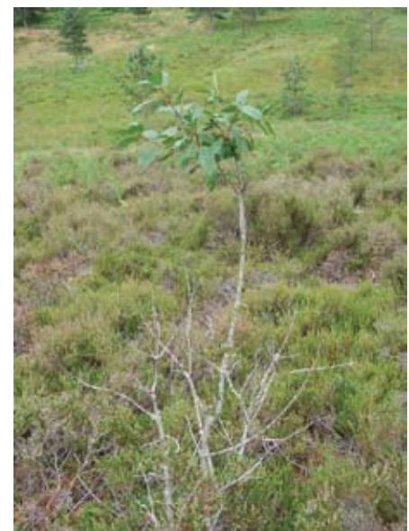
Effet du pâturage sur les arbustes : ici, un pied de bourdaine brouté sur sa partie basse