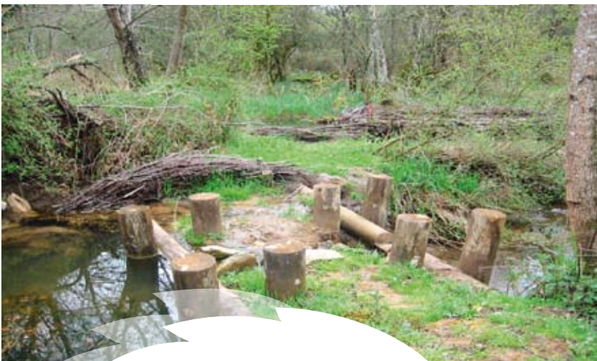
Création de barrage sur des drains principaux pour restaurer l'alimentation hydrique du milieu