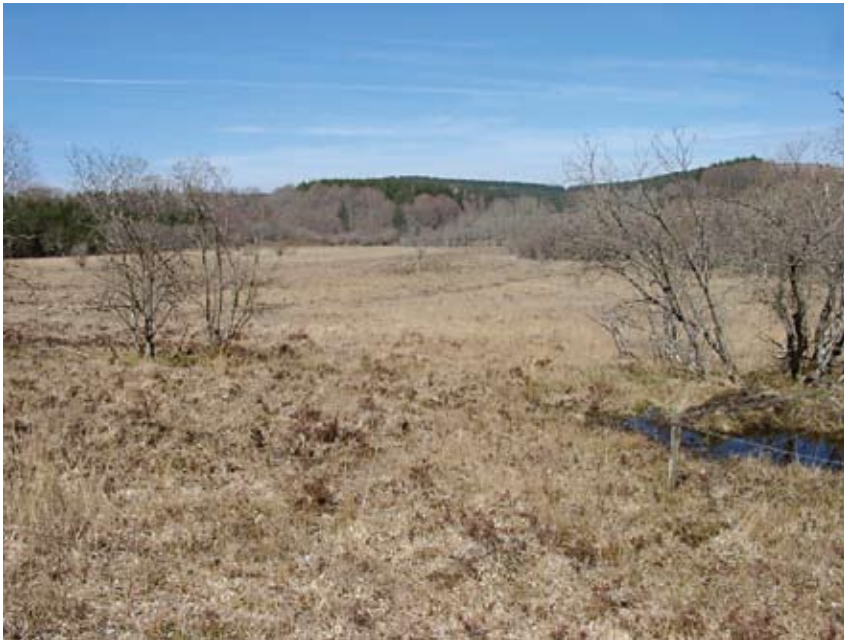
Vue hivernale de la tourbière de Canroute / monts de Lacaune

Ces zones humides sont majoritairement réparties en périphérie du Bassin : sud et sud-ouest du Massif-central et du piémont pyrénéen.