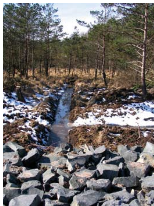
Drainage de zone humide en secteur forestier