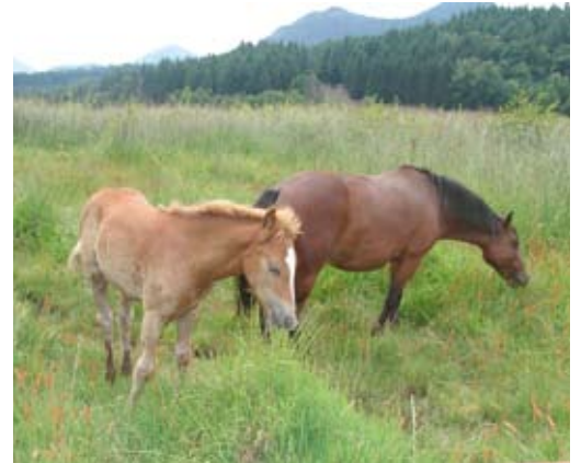
Poneys landais sur la tourbière de Lourdes

Cette évolution est ralentie par l' activité traditionnelle de pâturage .