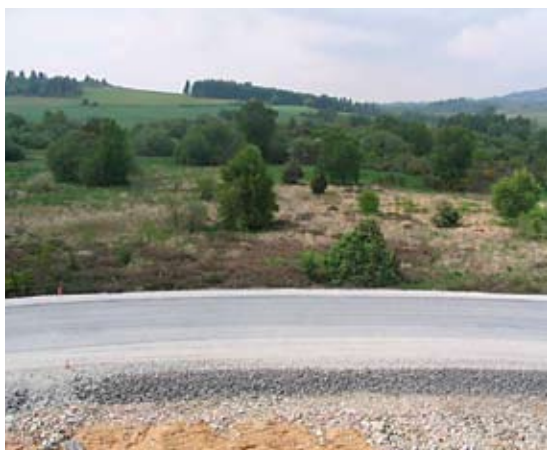
Infrastructure routière en remblai sur une tourbière

On assiste également à leur destruction par création de retenues d'eau pour irriguer les prés, lutter contre les incendies de forêt, soutenir les étiages ou constituer un espace de loisirs.