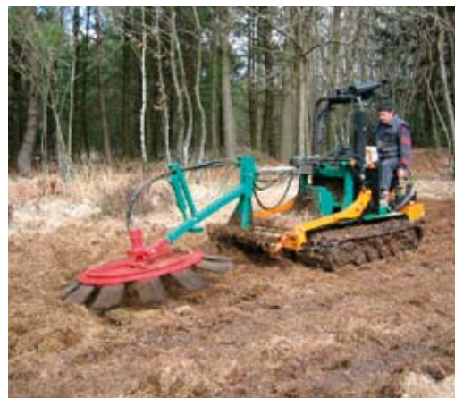
Travaux de décapage superficiel