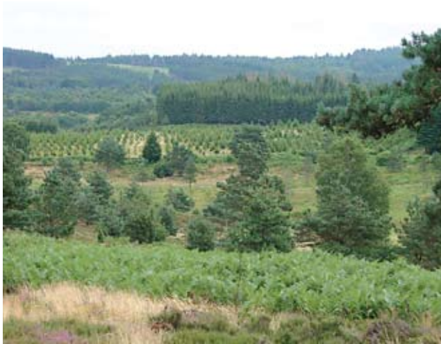
Enrésinement sur le plateau des Millevaches

La fermeture progressive du paysage perturbe le cycle de l'eau par enrésinement des massifs.