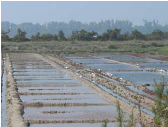
Fier d'Ars - Marais salants

Face au caractère de quasi-irréversibilité de ces situations dégradées, la protection des marais s'impose comme une évidence.