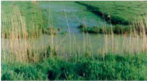
Baisse en marais : dépression humide dans la prairie en contact avec le fossé attenant

L'objectif à atteindre est de faire reconnaître ces fonctions d'intérêt général et de les intégrer de manière concertée dans les pratiques d'aménagement, de gestion et d'entretien de ces zones.