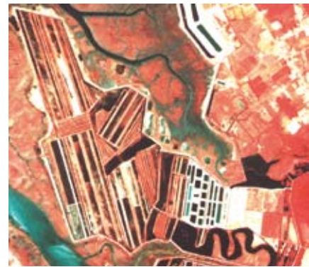
Réservoirs du domaine de Certes : digue avançant dans le Bassin d'Arcachon

aménagements des parcelles ou de l'état d'entretien des canaux, se traduit inévitablement par une détérioration de la diversité et de la richesse biologiques observées.