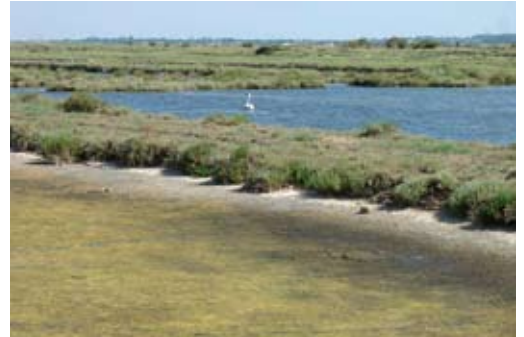
Pratique d'assec temporaire en marais salé : action de curage, lutte contre les algues filamenteuses et les agents pathogènes, oxydation des vases

Cette phase initiale de restauration n'aura d'effets durables qu'avec la mise en place d'usages compatibles avec tout ou partie des fonctions d'intérêt général, ces usages assurant un entretien et une gestion régulière des milieux terrestres et aquatiques.