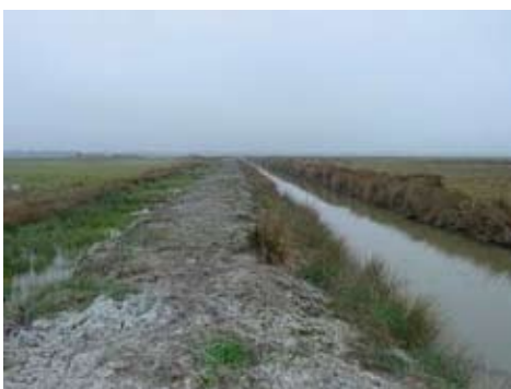
Curage de grand fossé avec respect de la végétation riveraine

Enfin la surveillance régulière des réseaux et la mise en œuvre d'actions coordonnées doivent permettre de lutter efficacement contre la prolifération de certaines espèces indésirables pouvant perturber le milieu : proliférations végétales (jussie...) ou animales (ragondins, écrevisses de Louisiane, ...)