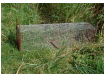
Piège-cage pour la régulation du ragondin

En ce qui concerne les ouvrages hydrauliques, une attention toute particulière sera portée aux problèmes de libre circulation de la faune piscicole, circulation fortement perturbée voire annihilée par des systèmes de clapets, des coudes PVC, la disparition des portes à flots et l'automatisation des systèmes de gestion, faute de cahiers des charges prenant en compte la dimension biologique de ces systèmes.