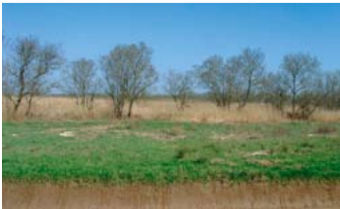
Enrichissement de parcelles du petit marais de Blaye