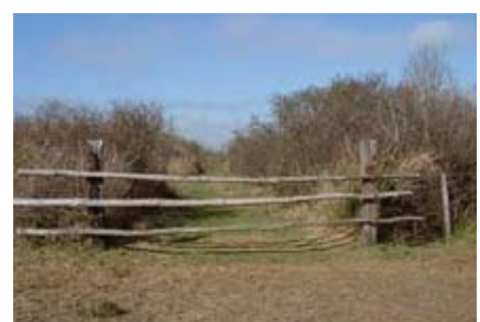
barrières traditionnelles de marais