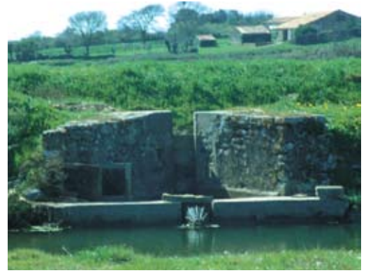
Ecluse à poissons (Payré-Talmont)

De même, certains départements ont classé ces marais au titre de leurs espaces naturels sensibles* et disposent donc de possibilités d'intervention qui complètent et renforcent la politique de protection. Dans ces deux cas, la réintroduction d'usages de production respectant des cahiers des charges adaptés à chaque contexte concourt à la gestion durable de ces territoires.