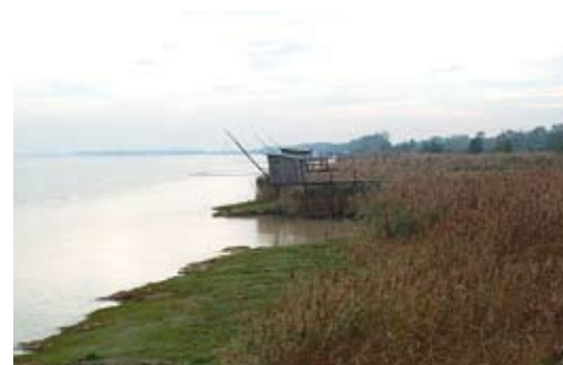
Estuaire de la Gironde

Le seul delta du bassin Adour-Garonne est celui de la Leyre : il se caractérise par une influence moindre de la marée et des dépôts de sédiments entre lesquels de multiples chenaux se créent.