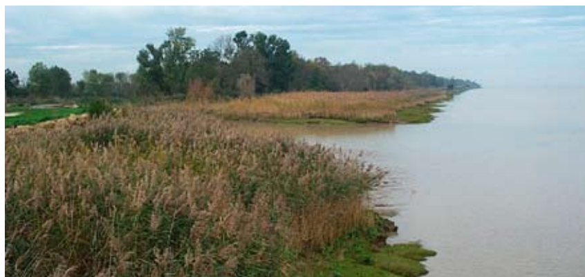
Roselière et boisement des rives de la Gironde