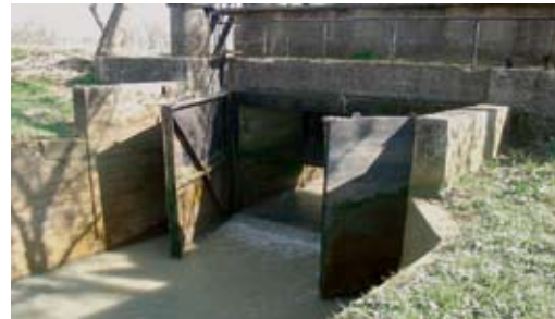
Porte à flots au petit marais de Blaye

Une grande vigilance doit être portée à la fois sur les activités humaines intervenant directement sur l'estuaire, notamment les creusements, et sur celles qui induisent des modifications profondes des zones humides associées. La connexion entre ces deux milieux est souvent permise par des ouvrages hydrauliques de type porte à flots, qui doivent faire l'objet de maintenance : de ce point de vue, ces espaces doivent être gérés collectivement au-delà de l'utilisation individuelle des parcelles agricoles.