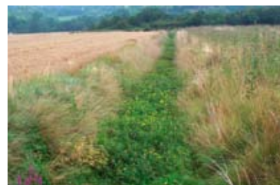
Fossé colonisé par la Jussie

Un suivi permet également de limiter les risques d'invasion des canaux par des espèces végétales indésirables comme la jussie. Déceler sa présence au plus tôt pour mettre en place des actions d'arrachage s'avère la méthode la plus efficace pour contenir son expansion.