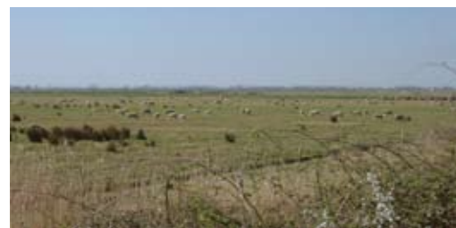
Pâturage -agneaux de Pauillac- dans les marais bordant la Gironde

Une gestion et un suivi des milieux peut alors se faire tout en maîtrisant la gestion de l'eau de façon à favoriser au maximum les fonctionnalités hydrauliques de la zone.