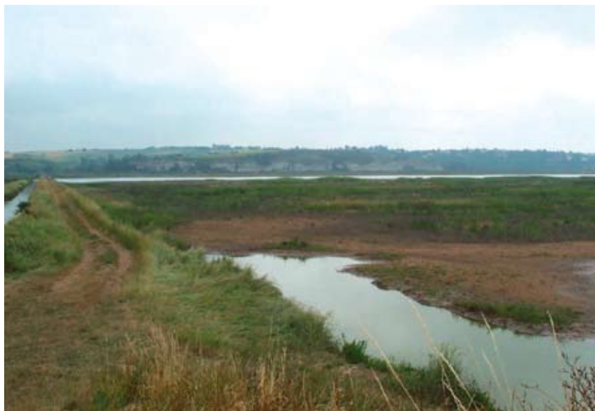
Marais de Mortagne

Des actions de reconquête peuvent être entreprises pour les zones humides poldérisées dans l'objectif de développer une activité agricole intensive.