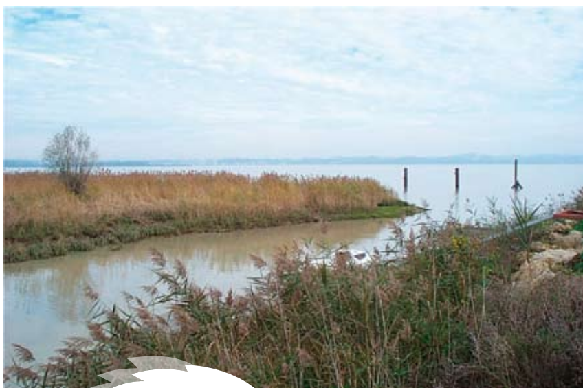
Roselières en bordure de Gironde

Le bassin Adour-Garonne comprend huit masses d'eau dites "de transition" correspondant à ces milieux (estuaire Charente, estuaire Seudre, Gironde amont, centrale et aval, estuaire Adour amont et aval, Bidassoa).