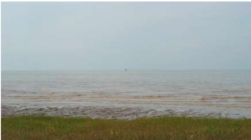
Rivage de la Gironde

Réserves de vie, leur destruction par endiguement, comblement ou creusement réduit la production biologique. Elle retentit sur la richesse de tout le littoral et sur l'importance des pêches estuariennes et côtières.