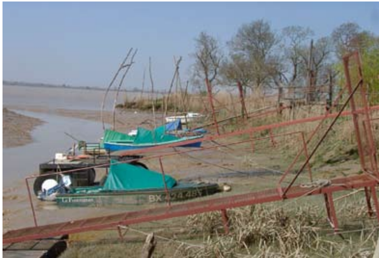
Port de pêche traditionnel de la Gironde

Les zones humides riveraines sont constituées de vasières, de roselières puis de bandes boisées. Elles ont assuré une protection importante des terrains situés plus en recul lors des tempêtes. La productivité biologique* y est très forte et les fonctionnalités nombreuses, cet écotone absorbant à la fois les flux d'eau en provenance de l'estuaire et ceux en provenance des petits bassins versants. Sur le bassin Adour-Garonne, les activités de pêche professionnelle se maintiennent essentiellement dans ces secteurs.