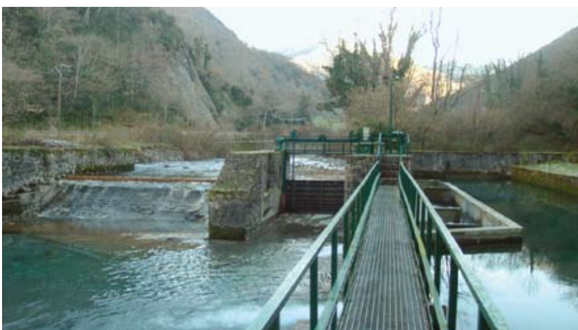
Modifications du lit du cours d'eau de montagne liées à la présence d'un barrage