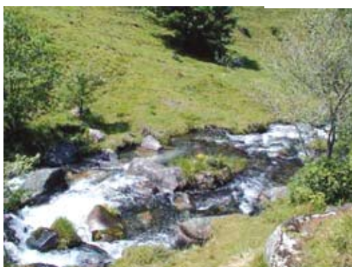
Torrent en zone d'alpage