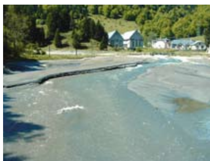
Série de méandres serrés.

globalement identiques à celles des matériaux qui arrivent en amont de la retenue. La fonction de transit du débit solide est ainsi restaurée.