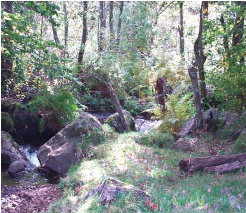
Torrent en sous bois

L'état préservé de ces milieux est avant tout lié à l' absence d'altération physique (seuils, barrages...). Situés en altitude ou en zones boisées, ces cours d'eau ne nécessitent pas d'intervention de gestion. Une surveillance est à mettre en œuvre notamment sur certains secteurs sensibles au niveau des risques naturels tels que glissement de terrain, laves torrentielles... Ces milieux préservés ont un fort intérêt pour la biodiversité végétale et animale et la diversité des habitats dans le chenal et ses marges. Ce sont aussi des zones d'alimentation en sédiments qui participent activement au transit amont-aval.