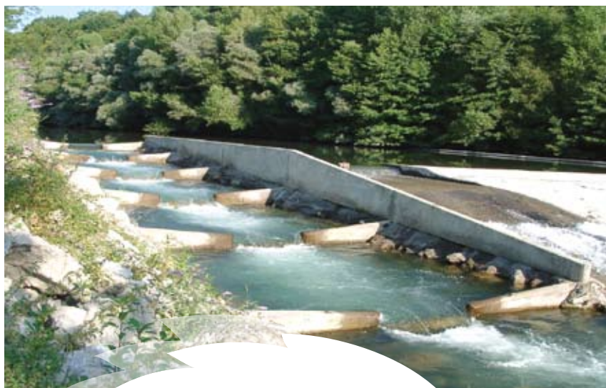
Passé à poisson d'alpage

Les autres sources de dégradation notoires sont le piétinement des cours d'eau et l'enrichissement en matière organique (déjections) par les troupeaux de bovins/ovins dans les zones de pâturage/estive (zones de plateaux intermédiaires, jasses). Le problème peut être solutionné par la mise en place de barrières (fixes ou temporaires électriques) avec point d'accès restreint au torrent et/ou pompes pour abreuvage à la demande.