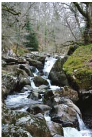
Torrent en zone d'alpage

Ces torrents * se caractérisent de la façon suivante :