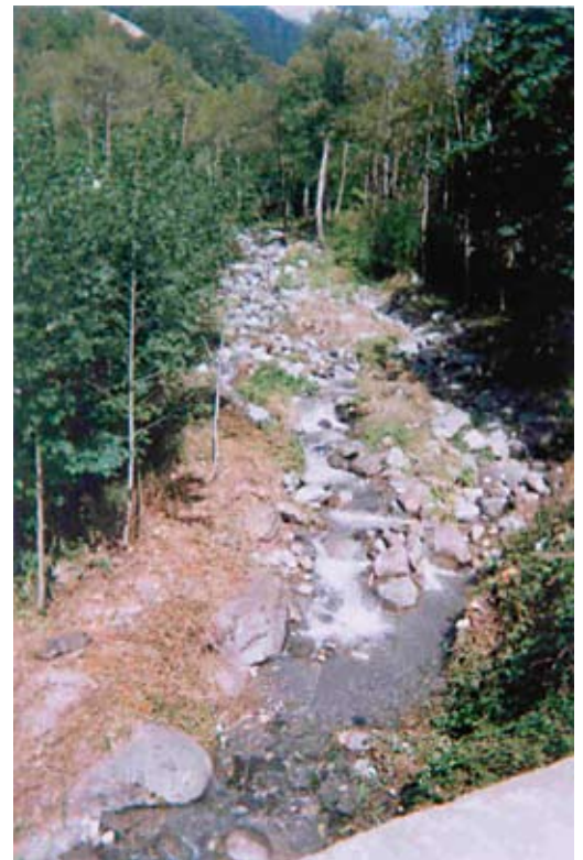
Lit du ruisseau constitué de gros blocs

Les embâcles* qui se constituent par accumulation de bois accentuent la diversification des faciès d'écoulement qui sont essentiellement liés à des modifications de pente. Sur les cours d'eau très contraints par les activités humaines, il sera nécessaire de surveiller ce type d'événements de façon à ne pas accentuer le dérangement de certaines espèces emblématiques.