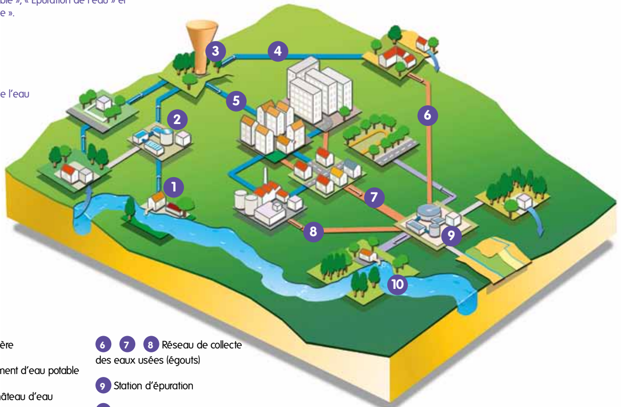
Cycle domestique de l'eau